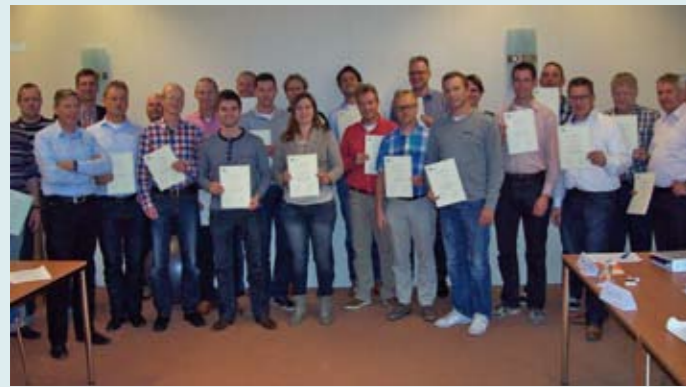
Deelnemers aan de cursus Essenties van Cost Engineering.