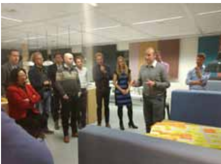
Werkessie bij de informele VM bijeenkomst Auping

In september organiseerde stichting De Bouwcampus in samenwerking met de SIG VM een VM-workshop voor haar partners. De Bouwcampus is dé ontmoetingsplaats waar partijen samen innovatieve oplossingen creëren voor vraagstukken op het gebied van leven, wonen en werken. Er zijn meer dan 120 bedrijven, overheidsorganisaties en kennisinstituten aan