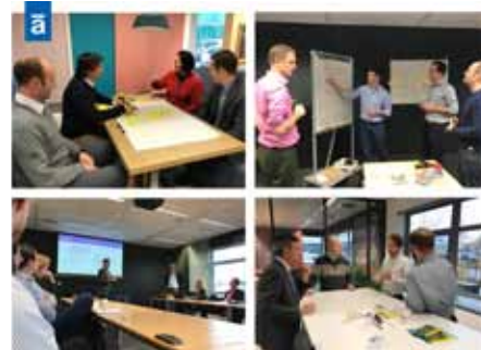
Compilatie VE sessie Auping

organisaties, maar ook qua type persoon. Niet alleen hard skills, voor het uitdragen van kennis blijken belangrijk, maar zeker ook soft skills omdat de CE (en VE) vaak ook een verbindende en adviserende rol heeft. Naast deze rollen kan de CE/VE nog andere rollen vervullen, zoals bemiddelaar, procesbewaker, strateeg, enz. Bij dit beeld komt steeds vaker de behoefte naar voren naar meer kennis en inzicht in Value Engineering en Value Management. Eerdergenoemde cases bij Auping, Fokker en BDR onderstrepen dit. De kruisbestuiving tussen SIG CEMM en SIG VM bracht aan het licht dat de opleidingsbehoefte anders is dan welke via de training vanuit SIG VM worden gegeven. Deze mismatch gaan beide SIG's onderzoeken.