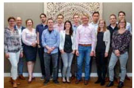
DACE Young professionals

Tijdens het eerste evenement zijn er twee dingen opgevallen. Het organiseren van een evenement met een beperkt budget is een uitdaging. Hiervoor zal uit het DACE-netwerk geput moeten worden. We komen dan ook graag in contact met deelnemers die ons met interactieve workshops willen helpen. Door drukke agenda's was de opkomst van de eerste bijeenkomst iets lager dan verwacht. Uitbreiding van de SIG staat op de agenda. In 2017 organiseert Young Professionals de eerste DACE YP-contactbijeenkomst. Hierin zullen 3 gastsprekers onderwerpen van de 'toekomst' presenteren. Op deze bijeenkomst willen de YP zich ook met een interactieve workshop voorstellen aan de overige DACE leden. Kortom 2017 belooft een mooi 'jong' jaar te worden!