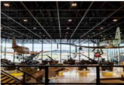
DACE/NVBK contactbijeenkomst in een HCB

In 2016 zijn de leden van de SIG HCB drie keer bij elkaar gekomen met als voornaamste doel de gezamenlijke netwerkbijeenkomst van DACE en NVBK op 29 september in het Nationaal Militair Museum in Soest.