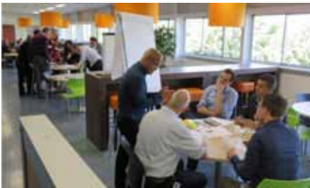
Simultane werksessies bij Fokker

In december stond een bezoek aan het puur Hollandse bedrijf Auping op het programma. De rondleiding in de fabriekshal in Deventer liet zien waarom het bedrijf al 125 jaar bestaat en dat kwaliteit heel hoog in het vaandel staat. In een VM-sessie werden de deelnemers uitgedaagd de traditionele spiraalbodempompe te optimaliseren. Het leverde Auping tal van interessante ideeën op. Een week later heeft Auping met succes een eerste interne VM-workshop georganiseerd! Zo'n snelle actie om de meerwaarde van VM in praktijk te brengen zien we graag vanuit de SIG VM.