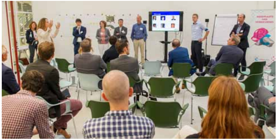
SIG VM op bezoek bij de Bouwcampus in Delft

In september organiseerde stichting De Bouwcampus in samenwerking met de SIG VM een VM-workshop voor haar partners. De Bouwcampus is dé ontmoetingsplaats waar partijen samen innovatieve oplossingen creëren voor vraagstukken op het gebied van leven, wonen en werken. Er zijn meer dan 120 bedrijven, overheidsorganisaties en kennisinstituten aan