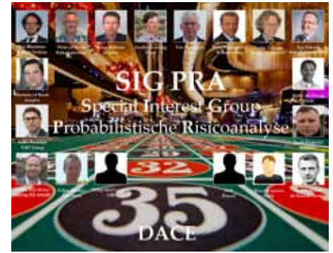
Deelnemers SIG PRA

In 2016 heeft de SIG zich met name gericht op definities en correlaties van PRA. Op het gebied van definities zijn verschillen en overeenkomsten inzichtelijk gemaakt. Er is een lijst met begrippen uit de SSK-2010 in relatie tot PRA opgesteld. Daaraan zijn definities ter verduidelijking toegevoegd en die zonder toegevoegde waarde geschrapt. Aan de hand van een overzichtelijk schema kan de opbouw van projectkosten nu bepaald worden, verdeeld over de categorieën Berekende waarde, Benoemd risico, Opslag geschat risico en Opslag onbepaald risico, waarbij er een 'of'-relatie