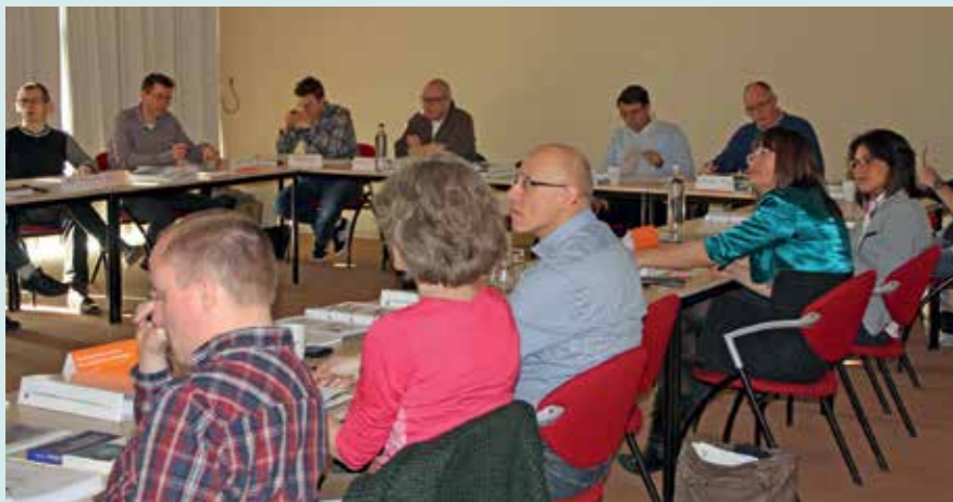
Deelnemers aan de training Essenties van Project Cost Control 2013.

Zij gaven de cursus bij de evaluatie een gemiddeld rapportcijfer 7,6. Gezien alle positieve feedback heeft DACE de EPPC-cursus inmiddels ook alweer voor maart 2014 georganiseerd (volgeboekt).